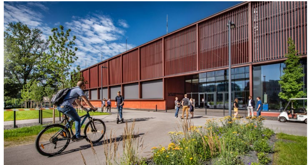
LIT Open Innovation Center